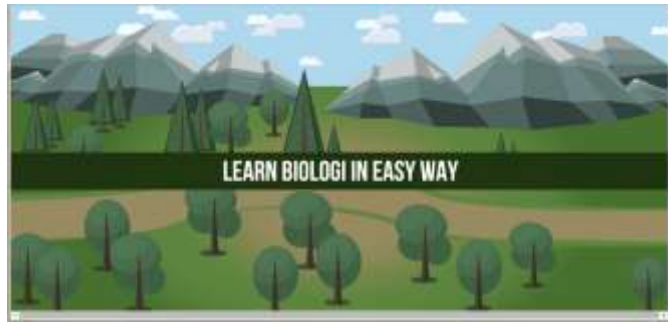
Gambar 2. Halaman intro perangkat ajar ‘ Learn Biologi in Easy Way ’

Pada halaman intro , akan ditampilkan animasi fade in nama aplikasi yang akan berlangsung selama lima detik. Setelah animasi ini berlangsung selama lima detik maka halaman akan langsung beralih ke halaman menu utama secara otomatis