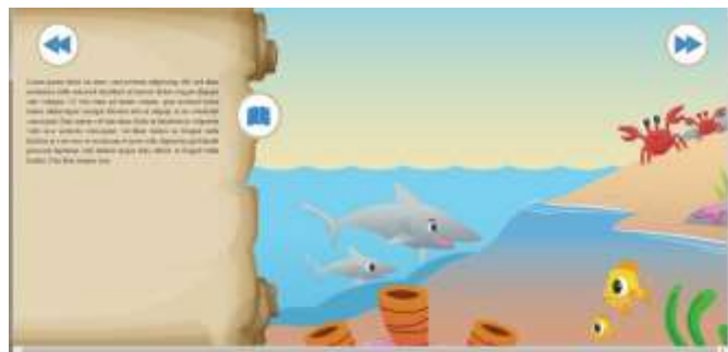
Gambar 4. Halaman materi biotik perangkat ajar ‘ Learn Biologi in Easy Way ’

Pada halaman materi biotik, pengguna dapat menyimak materi yang disediakan pada bagian kiri layar. Disediakan juga tombol previous agar pengguna dapat kembali ke halaman menu utama, disediakan juga tombol next untuk menampilkan materi selanjutnya mengenai biotik. Disediakan juga tombol read/unread untuk menghilangkan atau menampilkan kembali materi yang terletak di bagian kiri layar