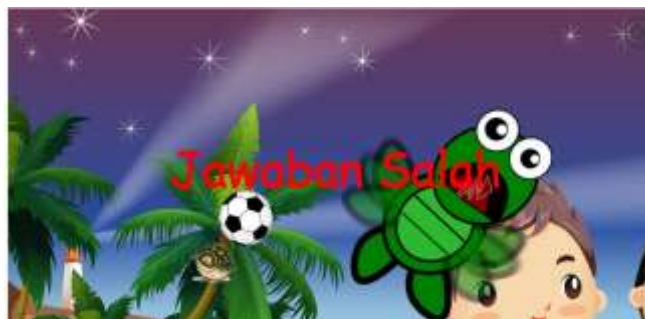
Gambar 7. Halaman kesalahan quiz perangkat ajar 'Learn Biologi in Easy Way'

Halaman quiz ini merupakan halaman evaluasi untuk pengguna dimana terdapat beberapa pertanyaan yang dapat dipilih oleh pengguna. Untuk memilih jawaban tersebut pengguna harus melemparkan kura-kura ke arah bola yang berfungsi sebagai jawaban. Disediakan juga tombol kembali ke halaman menu utama, yang terletak di bagian pojok kanan atas layar. Jika jawaban dari pengguna salah, maka akan tampil layar kesalahan (lihat gambar 7), jika jawaban pengguna tepat, maka quiz akan berlanjut ke quiz yang berikutnya dengan soal yang berbeda.