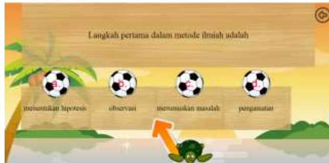
Gambar 6. Halaman quiz perangkat ajar 'Learn Biologi in Easy Way'

Halaman quiz ini merupakan halaman evaluasi untuk pengguna dimana terdapat beberapa pertanyaan yang dapat dipilih oleh pengguna. Untuk memilih jawaban tersebut pengguna harus melemparkan kura-kura ke arah bola yang berfungsi sebagai jawaban. Disediakan juga tombol kembali ke halaman menu utama, yang terletak di bagian pojok kanan atas layar. Jika jawaban dari pengguna salah, maka akan tampil layar kesalahan (lihat gambar 7), jika jawaban pengguna tepat, maka quiz akan berlanjut ke quiz yang berikutnya dengan soal yang berbeda.