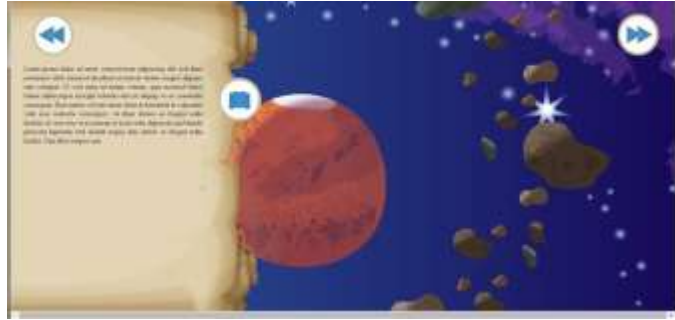
Gambar 5. Halaman materi abiotik perangkat ajar 'Learn Biologi in Easy Way'

Pada halaman materi abiotik, pengguna dapat menyimak materi yang disediakan pada bagian kiri layar. Disediakan juga tombol previous agar pengguna dapat kembali ke halaman menu utama, disediakan juga tombol next untuk menampilkan materi selanjutnya mengenai abiotik. Disediakan juga tombol read/unread untuk menghilangkan atau menampilkan kembali materi yang terletak di bagian kiri layar.