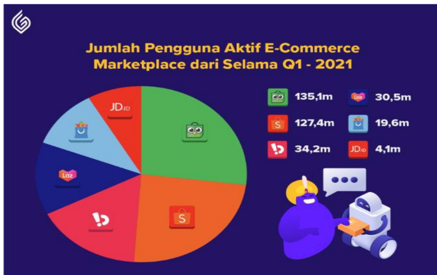
Gambar 2. Data Jumlah Pengguna Aktif E-Commerce Q1-2021

Data e-commerce paling diminati di atas diperkuat dengan data jumlah pengguna aktif sebagai berikut: