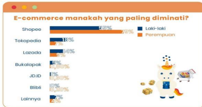
Gambar 1. Data e-commerce paling diminati tahun 2021

Berikut disajikan data e-commerce paling diminati tahun 2021 sebagai berikut: