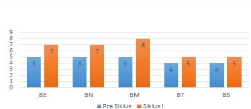
Gambar 4.2 Perbandingan Skor Contextual Teaching and Learning Pra Siklus dan Siklus I

Dari hasil Checklist Contextual Teaching and Learning diperoleh data perbandingan Pra Siklus dan Siklus I, yang terlihat pada gambar 4.2.