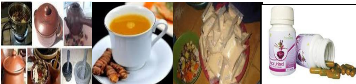
Gambar 6: Pengolahan Tanaman Obat dengan Cara Direbus, Diseduh, dan Dibuat Kapsul ( www.healthychoice.com ).

keras, maka untuk 100 bagian dekok harus dipergunakan 10 bagian bahan dasar atau simplisia.