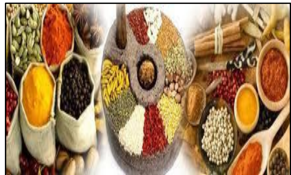
Gambar 2: Obat Bahan Alam

Pemakaian obat herbal biasanya digunakan untuk obat tradisional. Obat herbal mencakup tiga bagian yaitu: obat asli, obat tradisional, dan obat bahan alam (4). WHO mendefinisikan obat tradisional sebagai obat asli di suatu negara yang digunakan secara turun-temurun di negara itu atau di negara lain. Obat tradisional harus memenuhi persyaratan antara lain sudah digunakan minimal tiga generasi dan terbukti aman dan bermanfaat. Obat asli adalah suatu obat bahan alam dan ramuannya, cara pembuatannya, pembuktian khasiat, keamanan, serta cara pemakaian berdasarkan pengetahuan tradisional suatu daerah. Sedangkan obat bahan alam adalah semua obat yang berasal dari bahan alam yang dalam proses pembuatannya belum merupakan isolat murni. Obat bahan alam dapat berupa obat asli, obat tradisional, atau pengembangan dari keduanya.