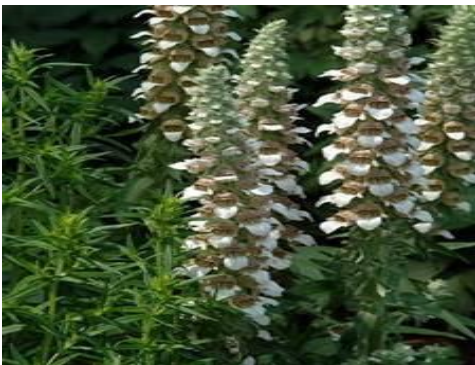
Gambar 4: Tanaman Digitalis Lanata dan Struktur Kimia Digoxin

Dalam tanaman terdapat lebih dari 10.000 senyawa organik yang berkhasiat sebagai obat. Isolasi pertama tumbuhan pertama kali dilakukan oleh Homole dan Quevenne pada tahun 1841, yang berhasil memisahkan digitoksin, digitalin, dan digitalein dari tanaman Digitalis purpurea . Digoxin adalah senyawa aktif yang diperoleh dari tanaman Digitalis lanata . Digoxin digunakan terutama untuk meningkatkan kemampuan memompa jantung dalam keadaan gagal jantung. Digoxin termasuk obat dengan therapeutic window yang sangat sempit. Karena itu kadar obat dalam plasma darah yang dapat menimbulkan efek terapi dan efek toksik sangat sempit. Masa kerja digoxin 30-50 jam, dimana kerjanya meningkatkan kekuatan kontraksi otot jantung karena penghambatan enzim \text{Na}^+ , \text{K}^+ ATPase dan peningkatan arus masuk ion kalsium ke inti sel. Digoxin juga berpengaruh pada aktifitas saraf otonom dan jantung terhadap neurotransmitter . Setelah senyawa aktif tersebut diisolasi, diidentifikasi, dilihat mekanisme kerja, dan struktur molekulnya, kemudian dibuat bentuk sediaan obat. 2