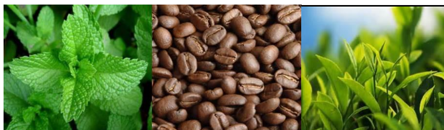
Gambar 3: Dari Kiri ke Kanan Daun Mint , Biji Kopi, dan Daun Teh

Berdasarkan asal mula biosintesisnya, metabolit sekunder terbagi menjadi tiga kelompok besar, yaitu terpenoid dan steroid, alkaloid, senyawa nitrogen dan fenilpropanoid, serta senyawa fenolat lainnya. Contoh tanaman yang mengandung terpenoid golongan monoterpen ialah daun mint , tanaman yang mengandung alkaloid ialah kopi, dan tanaman yang mengandung flavonoid ialah daun teh.