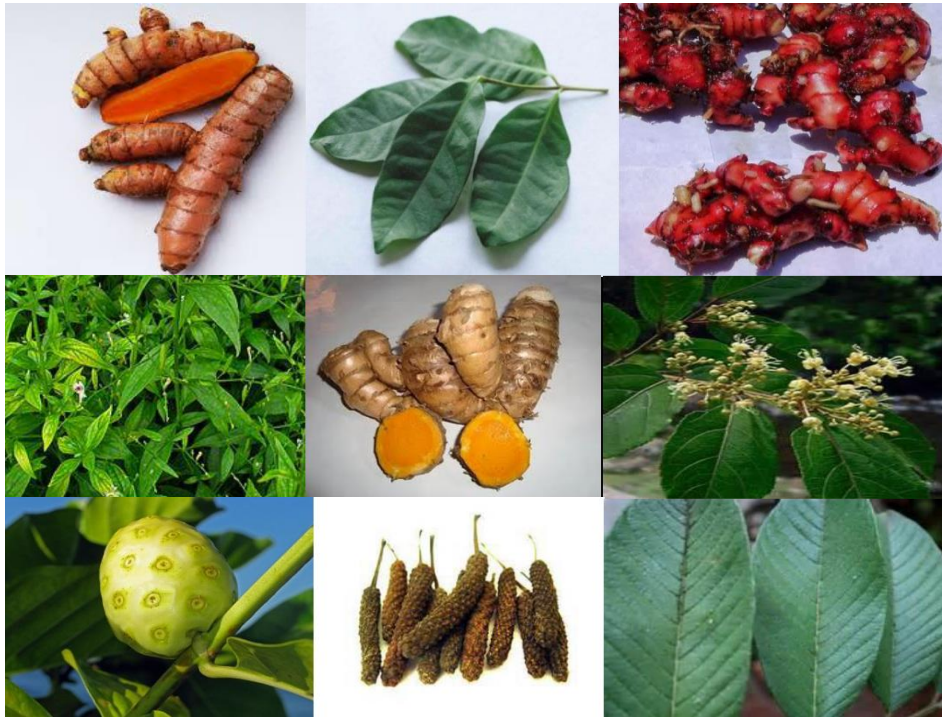
Gambar 5: Deretan Tanaman Obat Unggulan: Dari Kiri Atas Kunyit, Daun Salam, Jahe Merah, Jati Belanda, Temulawak, Sambiloto, Mengkudu, Cabe Jawa, Daun Jambu Biji